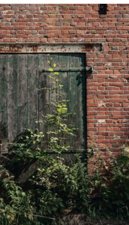
Grote foto linksboven: Bellingwolde, Hoofdweg 303, linksonder de achterdeur van de schuur op hetzelfde adres. Rechts van boven naar beneden: Bellingwolde Hamsterweg 24, Bellingwolde Hoofdweg 301, Bad Nieuweschans Hamdijk 47.